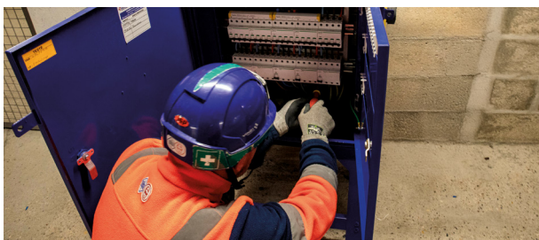
Préparation d'une armoire électrique à l'atelier hors tension