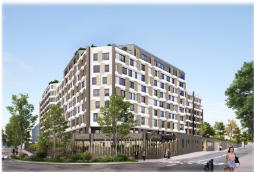
Cité Internationale de la Recherche, Nanterre

Transformation de bureaux en résidence coliving, commerces, restaurant et espaces incubateurs.