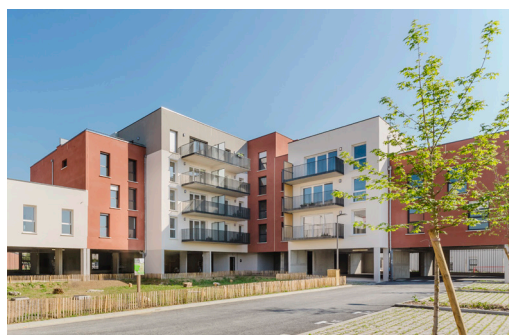
Résidence L'Ecrin, Venette

Primméa est l'offre innovante de logements qualitatifs, abordables et écoresponsables de VINCI Construction conçue pour faciliter l'accèsion à la propriété au plus grand nombre .