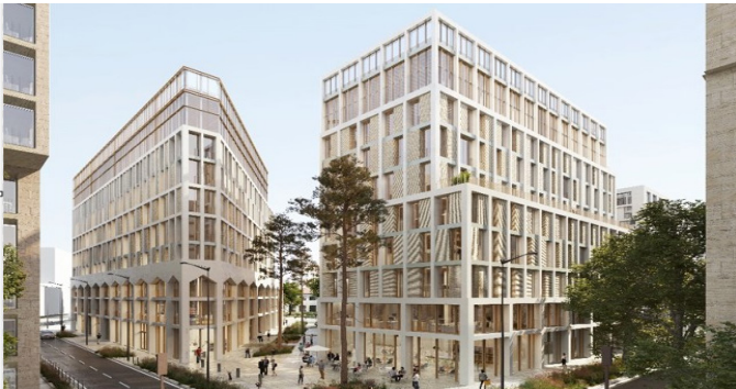
Immeubles de bureaux, Les Cimes, Bordeaux