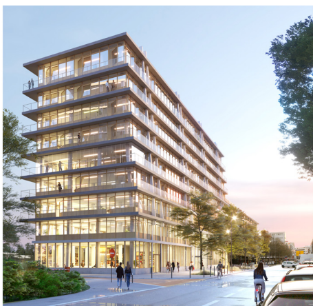
Immeuble de bureaux, Le Solférino, Rennes