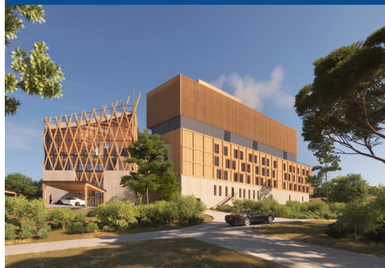
24H hôtel, Le Mans

Une conception sobre, maîtrisant les ressources en eau et en énergie.