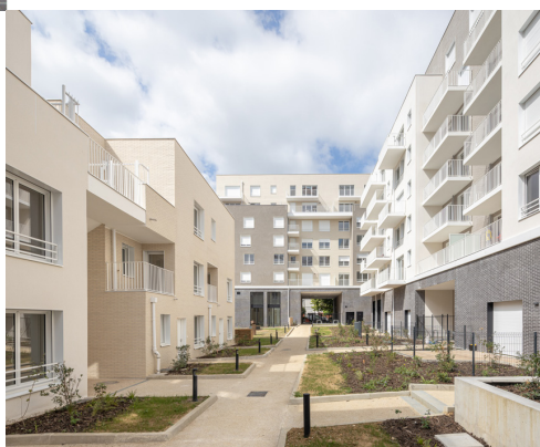
Zac Les Ardoines, Vitry-sur-Seine

Réaliser des projets innovants et sur mesure, y compris les plus complexes, associés à un objectif d'excellence environnementale et opérationnelle.