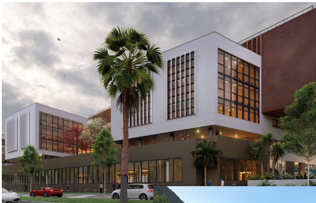
Immeuble de bureaux, le Mercantour, Nice