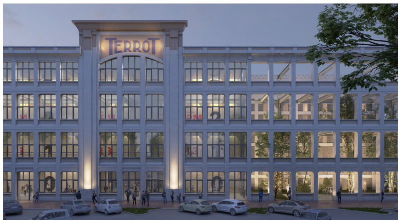
Ancienne usine Terrot, Dijon

Reconversion du site industriel Terrot en logements, résidences étudiants et jeunes actifs, Ephad, école et restaurant, autour d'un cœur d'îlot végétal.