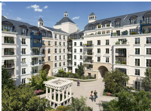
L'Isle Langevin, Le Plessis Robinson

Concevoir l'environnement urbain pour relever les défis sociétaux de demain.