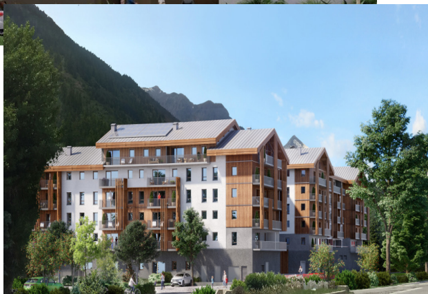
Résidence de tourisme, les Îles, Serre-Chevalier