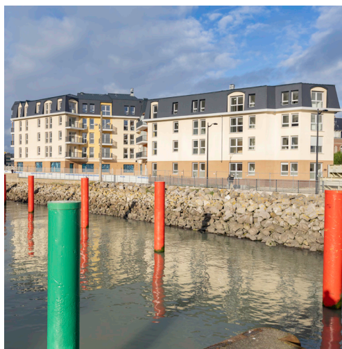
Résidence Le Phare, Le Tréport

Au fil des années et des projets, ADIM a acquis un savoir-faire indispensable pour anticiper les besoins évolutifs des bâtiments, dès la phase de conception, et pour favoriser leur adaptabilité et leur pérennité. Doté d'une stratégie d'aménagement au service de la décarbonation, ADIM propose des ouvrages adaptables aux usages de demain tout en évitant le recours à la déconstruction.